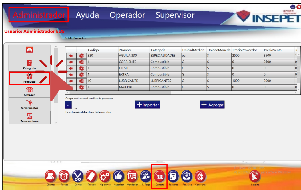
Imagen 1. Interfaz Módulo Canasta

Estos parámetros son configurables de la siguiente manera: